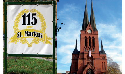
Kirchweihjubiläum St. Markus

13. November 115 Jahre Kirchweihe St. Markus