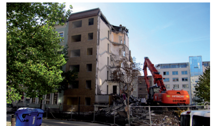
Abbruch Freiburger Straße 14