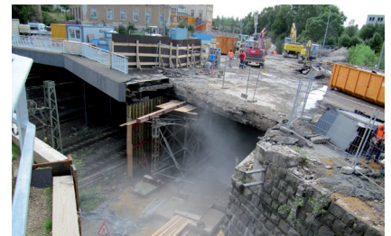
Abbruch Brücke Dresdner Platz