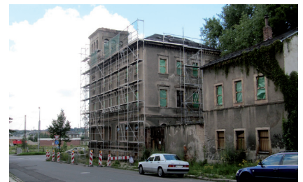
Sicherung der Villa Rudolph