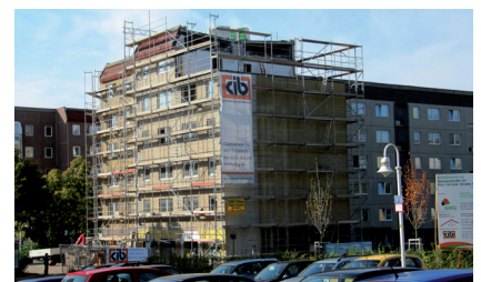
Sanierung Paul-Arnold-Straße 5