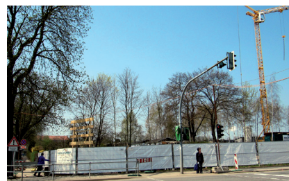
Baubeginn Ärztehaus „Polymed“