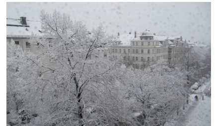
Winter auf dem Sonnenberg

24. November Auch auf dem Sonnenberg beginnt es zu schneien und mit nur wenigen Tagen Unterbrechung schneit es bis zum Jahresende, allein im Dezember 25 Tage.