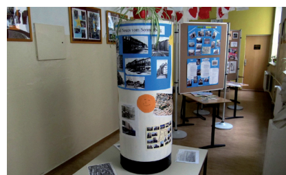
Projektwoche in der Pestalozzischule