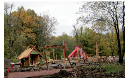
Spielplatz im Zeisigwald