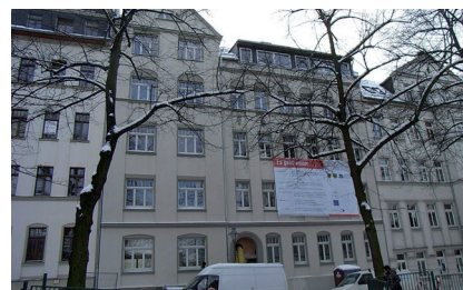
ehemalige Wäscherei Fürstenstraße