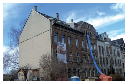
Hofer Straße 33