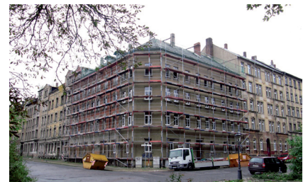
Sanierung Lessingplatz 14