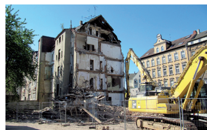
Abbruch Palmstraße 27

12. Juni Familienfest des Vereins Selbsthilfe Wohnprojekt Further Straße im Kinder- und Jugendhaus Substanz, Heinrich-Schütz-Straße 47 anlässlich des 20-jährigen Bestehens.