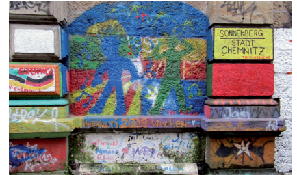
Caritas-Projekt „Art Mauer“