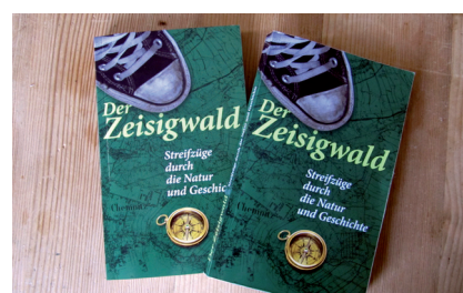
Buch „Der Zeisigwald“

08. Mai Das Florian-Geyer-Ensemble feiert sein 60-jähriges Bestehen in der Aula des Keplergymnasiums (ehemals Humboldtschule) auf der Humboldthöhe. Das Ensemble entwickelte sich aus der 1950 gegründeten Musikgruppe des VEB Fahrzeugelektrik (ehemals Fabrik Riemann) und gab sich 1955 den Namen Florian-Geyer-Ensemble.