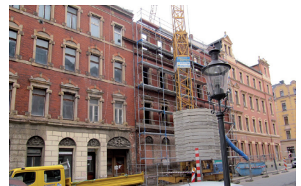
Sicherung Gießerstraße 23