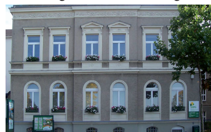
100 Jahre SWG

30. Juli Die Behelfsbrücke am Dresdner Platz ist fertiggestellt worden und wird ab 14 Uhr für den Verkehr freigegeben.