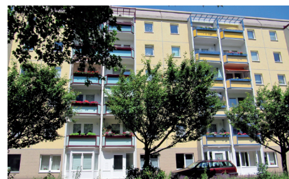
Wohnprojekt „Wolke 7“

23. April Straßenfest des Don Bosco Hauses mit über 500 Personen, großteils Kinder und Jugendliche, mit Vorstellung des neuerworbenen Grundstücks Ludwig-Kirsch-Straße 15, das bereits farbenprächtig bemalt wurde.