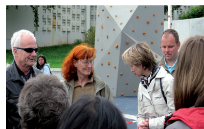
Eröffnung der „Bunten Gärten“

Juni Der Verein Nachhall will noch im Monat Juni sein Pilotprojekt mit dem Pflanzgarten zwischen der Zieten-, Tschaikowski- und Augustusburger Straße zur Zucht von Blumen, Gräsern und Kräutern starten.