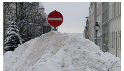
Einstellung der Schneeberäumung

22. Dezember Die Schneeberäumung durch den Stadtreinigungsbetrieb ASR ist auf dem Sonnenberg bis Anfang Januar 2011 eingestellt worden.