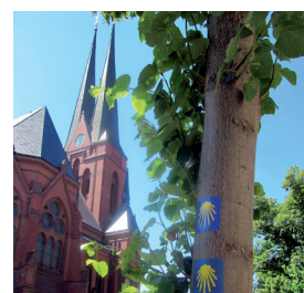
Jakobsweg auf dem Sonnenberg

24. Juli Begehung des Jakobsweges zwischen Oederan und Chemnitz über den Sonnenberg vom Zeisigwald über die Würzburger Straße - Pestalozzistraße - Martinstraße - Sonnenstraße - Hainstraße - Augustusburger Straße. Gekennzeichnet ist der Weg durch die Aufkleber mit der gelben Jakobsmuschel auf blauem Untergrund.