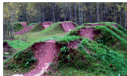
Dirtstrecke an der Forststraße