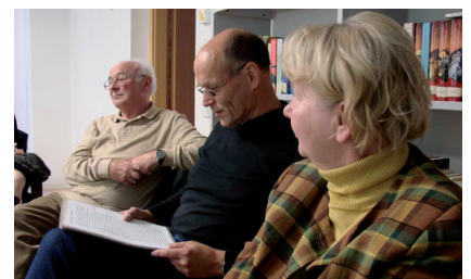
Buchlesung AG Sonnenberg-Geschichte