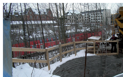
Bau der Behelfsbrücke Dresdner Platz