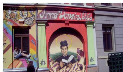
Don Bosco Haus

Mai Der Sonnenberg ist als Fördergebiet ausgewiesen. Damit werden kleine Unternehmen auf Antrag mit Zuschüssen für Investitionen und die Schaffung neuer Arbeitsplätze unterstützt.