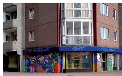
Jugendzentrum Sonnenstraße 24

01. Juni Das Jugendmedienzentrum „Bumerang“ und der Kinder- und Jugendklub „Mikado“ öffnen auf Grund von Sparzwängen ihr neues gemeinsames Domizil in der Sonnenstraße 24, der bisherige Standort Sonnenstraße 42 war zu groß.